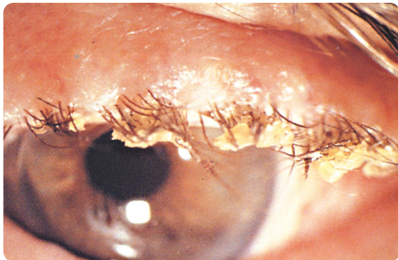
Symtom på blefarit.